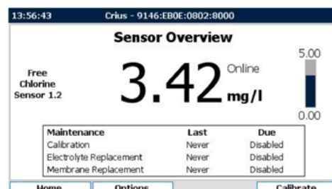
Schermate relative al sensore di cloro (libero)